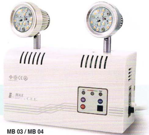
MB 03 / MB 04