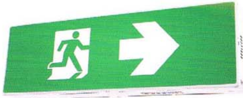
EXB 221 / EXB 222