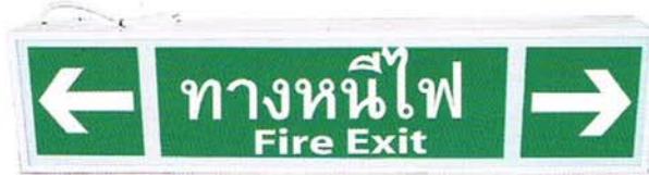
EXB 421 / EXB 422