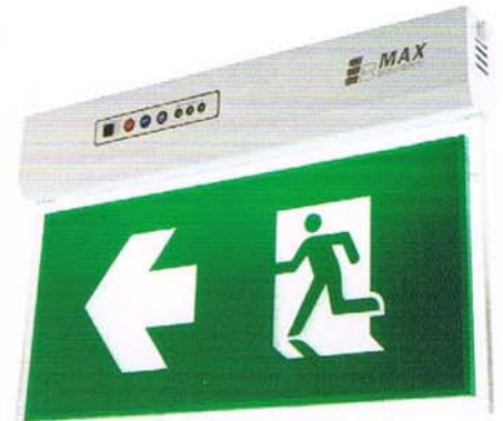
EXB 303 SCE / EXB 303 TCE Ceiling mount type