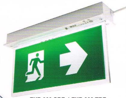
EXB 303 SRE / EXB 303 TRE Recess mount type